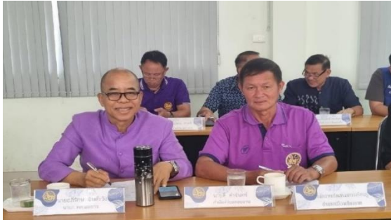
การประชุมหัวหน้าส่วนราชการ อำเภอเมืองเชียงราย

ส่งเสริม สนับสนุนการพัฒนาศักยภาพ สร้างขวัญกำลังใจผู้นำท้องถิ่น ท้องถิ่น อปพร. ชรบ. และสายตรวจอาสาอย่างทั่วถึง