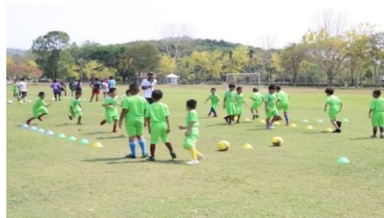
โครงการจัดการแข่งขันกีฬาเด็กปฐมวัย ศูนย์พัฒนาเด็กเล็กสังกัดเทศบาลตำบลแม่ยาว