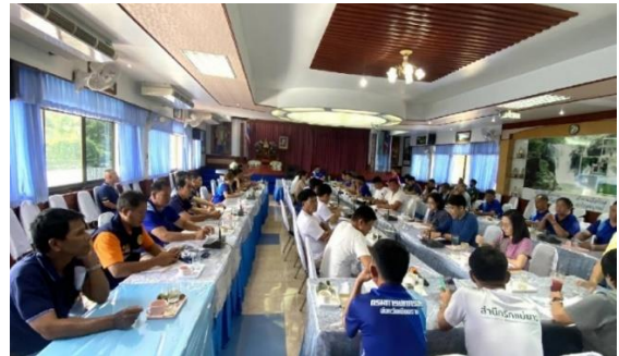
การประชุมหัวหน้าส่วนราชการระดับอำเภอ นายกองค์กรปกครองส่วนท้องถิ่น และกำนันอำเภอเมืองเชียงราย