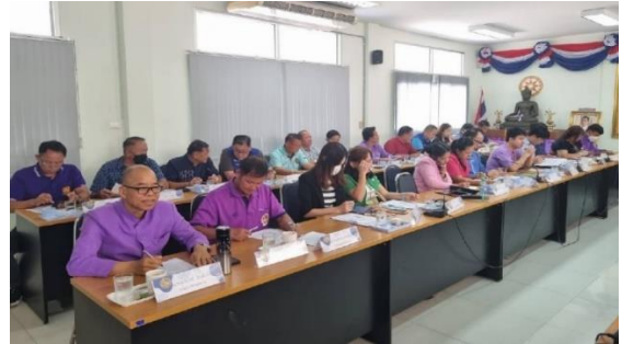
การประชุมฝ่ายหัวหน้าส่วนราชการตำบลแม่ยาว