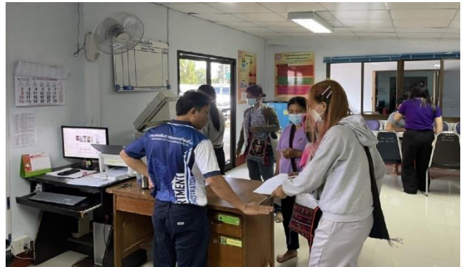
โครงการฝึกอบรมเพิ่มศักยภาพผู้สูงอายุตำบลแม่ยาว