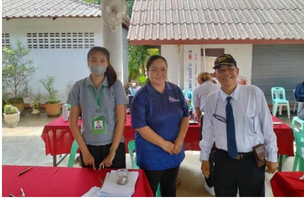
การเปิดรับลงทะเบียนผู้สูงอายุ ภายใต้โครงการเบี้ยยังชีพผู้สูงอายุ

ผู้พิการ ผู้สูงอายุ ได้รับการสำรวจประเมินเพื่อดูแล พัฒนาศักยภาพ ส่งเสริมอาชีพ คุณภาพชีวิต รายบุคคล