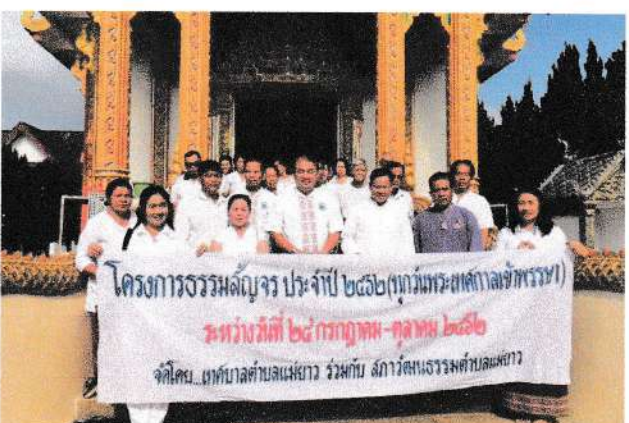
โครงการธรรมสัง្កจร ประจำปี ๒๕๖๒ (ทิวพระศตกาลเจ้าพรหม) ระหว่างวันที่ ๒๕ กรกฎาคม - ตุลาคม ๒๕๖๒ จัดโดย มูลนิธิบาลีสหประชาชาติ ร่วมกับ สภาวัฒนธรรมตำบลแม่ยาว